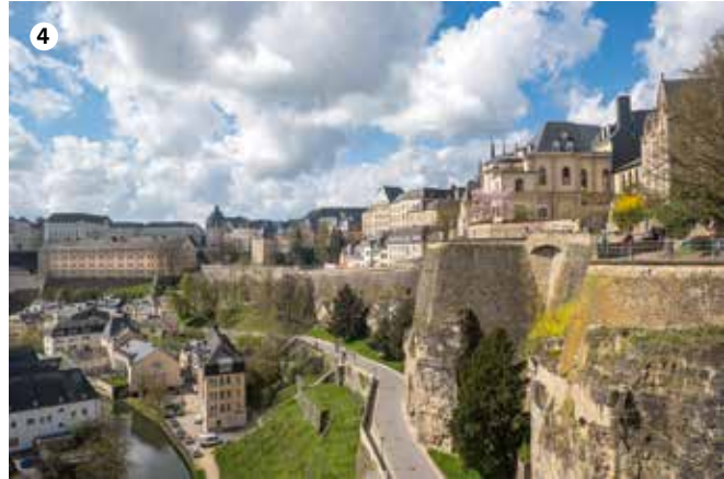
1 Zitadell um Hellege Giescht 2 Park an der Pétrusse 3 Stater Park 4 Vue op d'Orniche