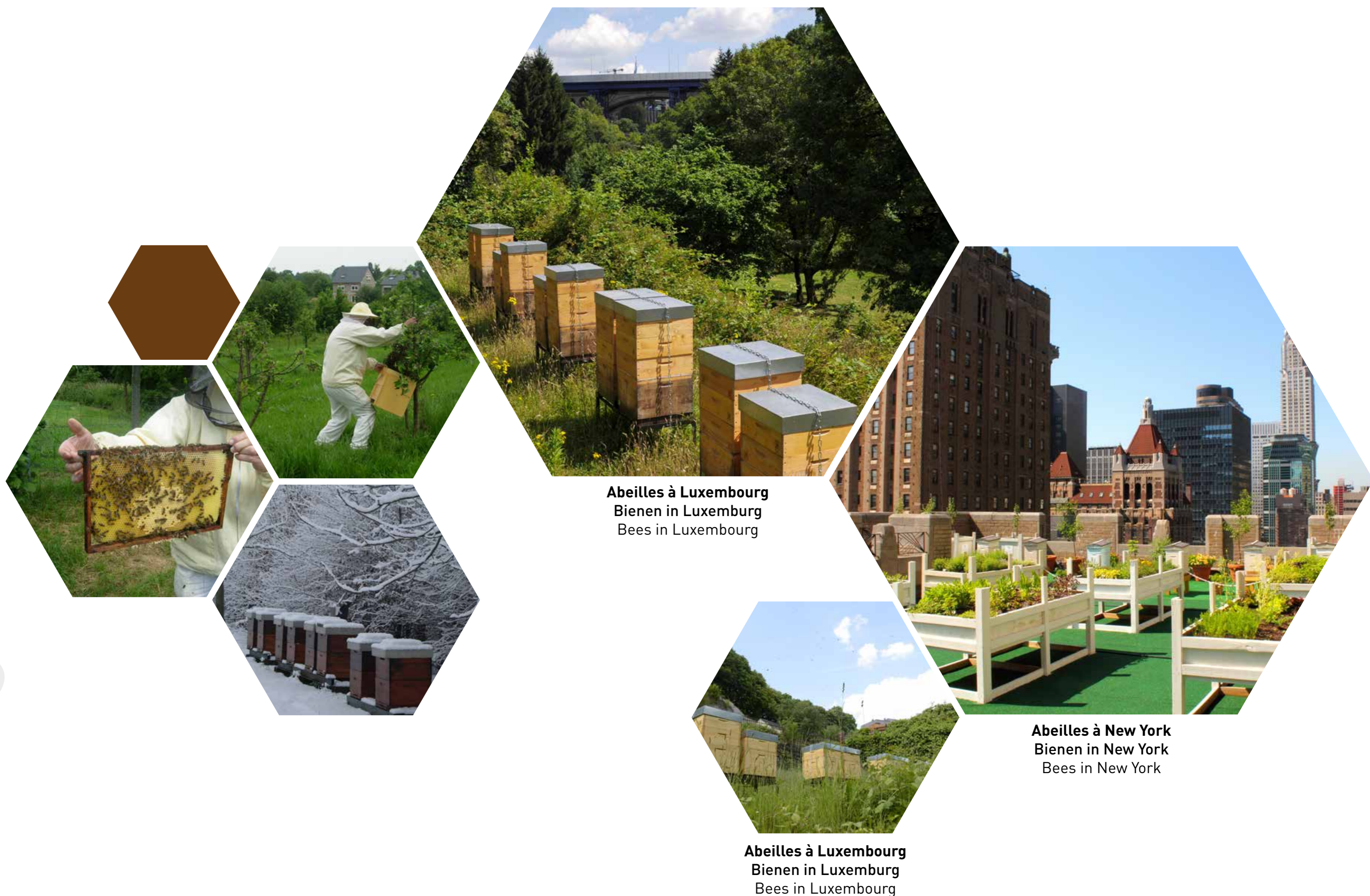
Abeilles à Luxembourg Bienen in Luxemburg Bees in Luxembourg